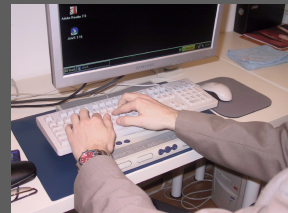
Abbildung 1: Benutzung einer Braillezeile

Auch Sehbeeinträchtigte und Blinde können Beiträge aus dem Internet lesen. Dazu wird der Text in einem Online-Forenbeitrag mittels einer Braillezeile, also einem Computer-Ausgabegerät für Blinde, in Brailleschrift umgewandelt. Die auf der Braillezeile erzeugten Erhöhungen in Blindenschrift können dann mit den Fingerspitzen abgegriffen werden. Der gleiche Text könnte durch ein „Screenreader-Programm“ alternativ laut vorgelesen oder mittels Vergrößerungssoftware größer dargestellt werden.