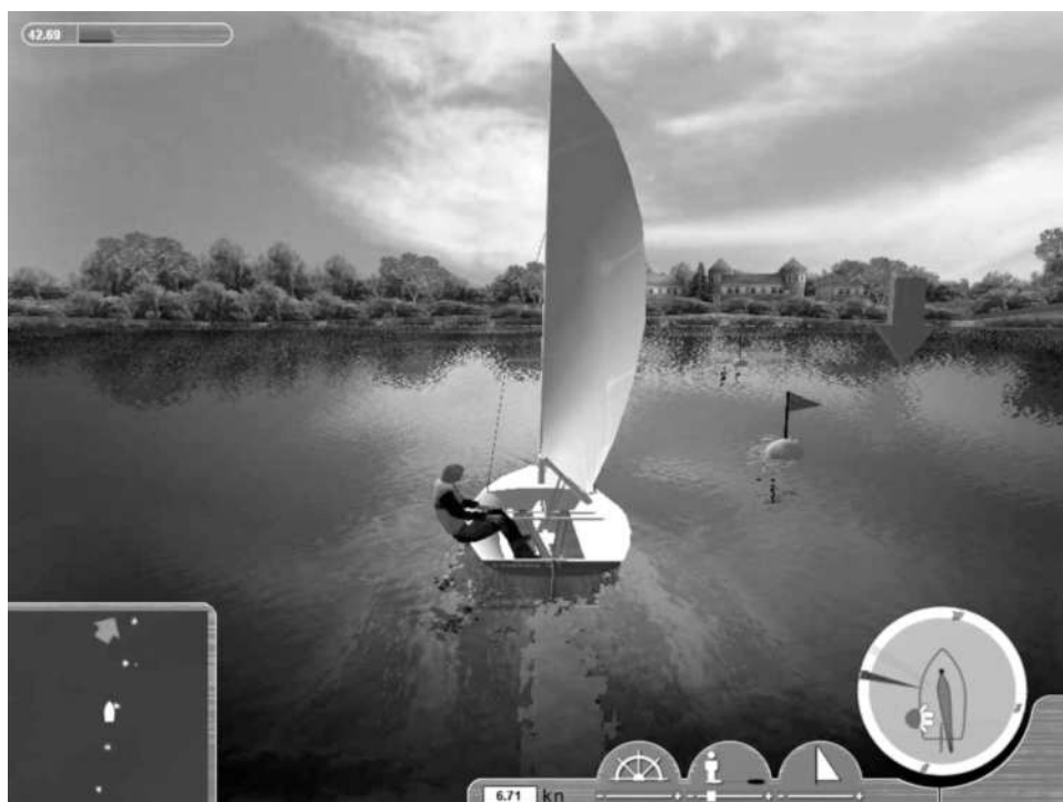
Abb. 2: User Interface von "e-Törn" mit dem in dieser Übung exklusiv definierbaren Steuerelement "Gewicht"

Hier setzt die interaktive Simulation und Lernhilfe ‚e-Törn‘ an, indem die zentralen Übungsformen der Segelpraxis jeweils digital adaptiert sind (vgl. Abb. 2). Die Reflexion der Segelpraxis wird damit über die Simulation des zuvor auf dem Wasser Erlebten unterstützt. Die auf dem Wasser beispielsweise angebaute subjektive Theorie, welchen Einfluss der Einsatz des eigenen Körpergewichtes auf die Fahrtrichtung des Bootes hat, lässt sich damit eigenaktiv rekonstruieren und validieren (vgl. Hebbel-Seeger, 2009a).