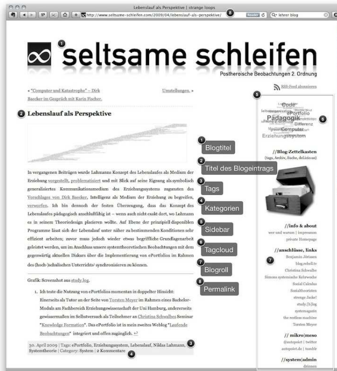
Abb. 1: Jargon und Funktionen von Blogs.