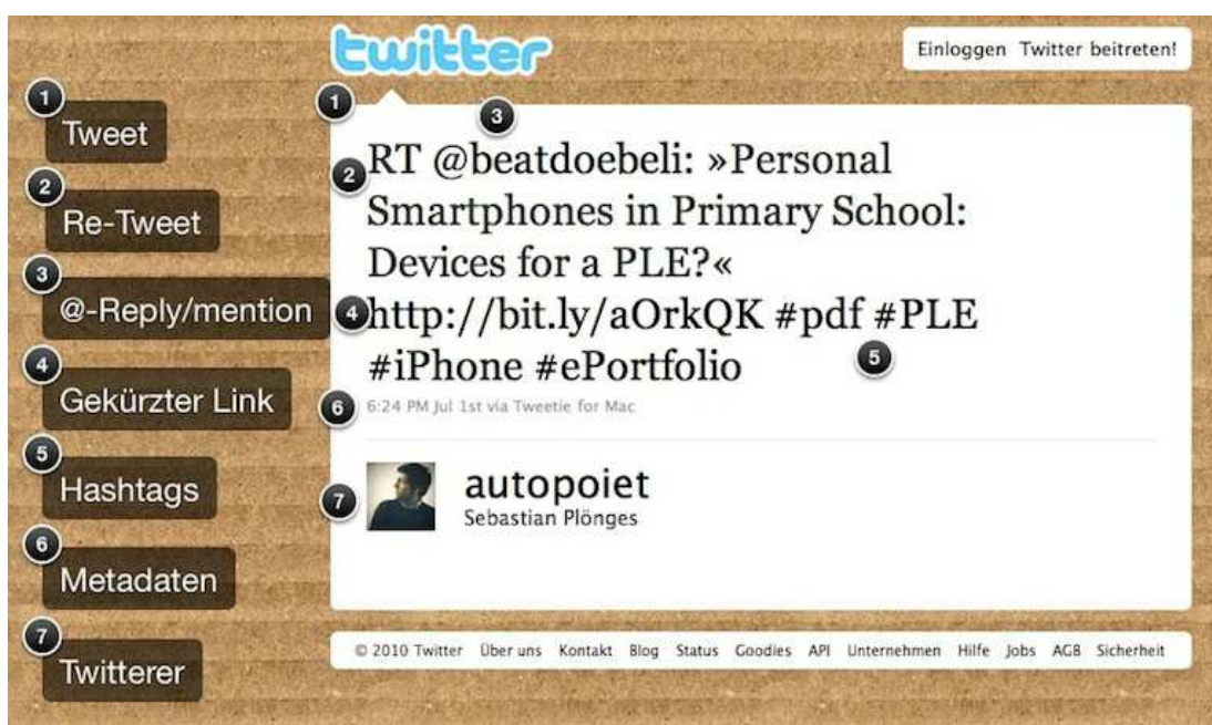
Abb. 2: Jargon und Funktionen des Microbloggingsystems Twitter.

CC BY-SA Ralf Appelt | L3T | http://l3t.eu http://creativecommons.org/licenses/by-sa/3.0/de/